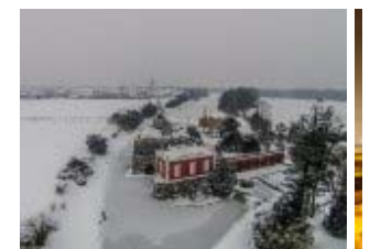
Winter im Gartenreich