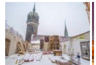
Baustellenführung im Wittenberger Schloss