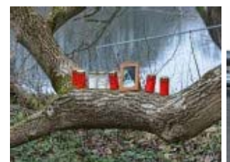
Spurensuche nach Leichenfund in Dessau

Die Bildergalerien Dessau-Roßlau präsentiert: