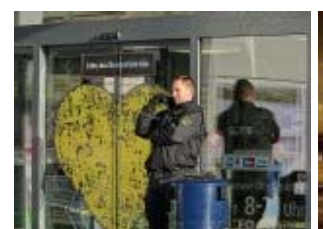
Falscher Bombenalarm in Dessau